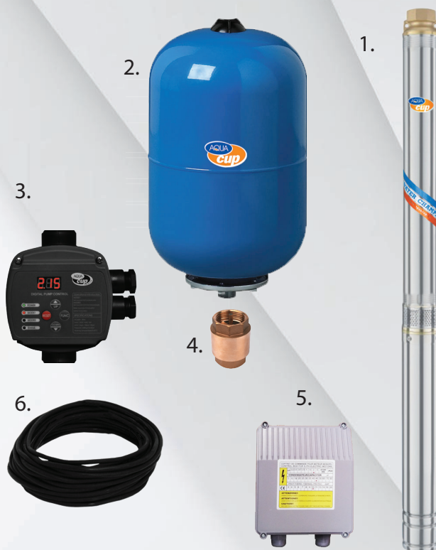
1. Čerpadlo 3,5" ELECTRA